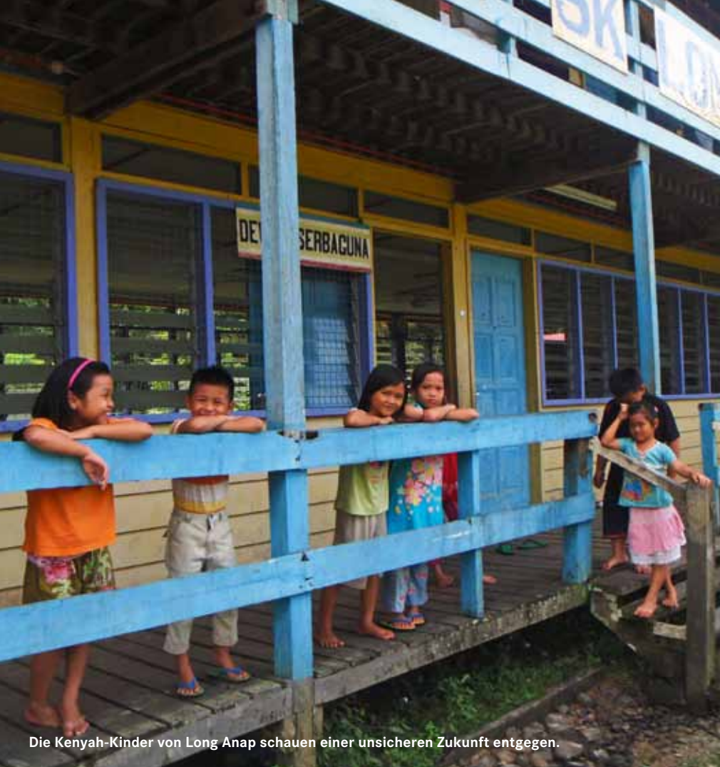
Die Kenyah-Kinder von Long Anap schauen einer unsicheren Zukunft entgegen.