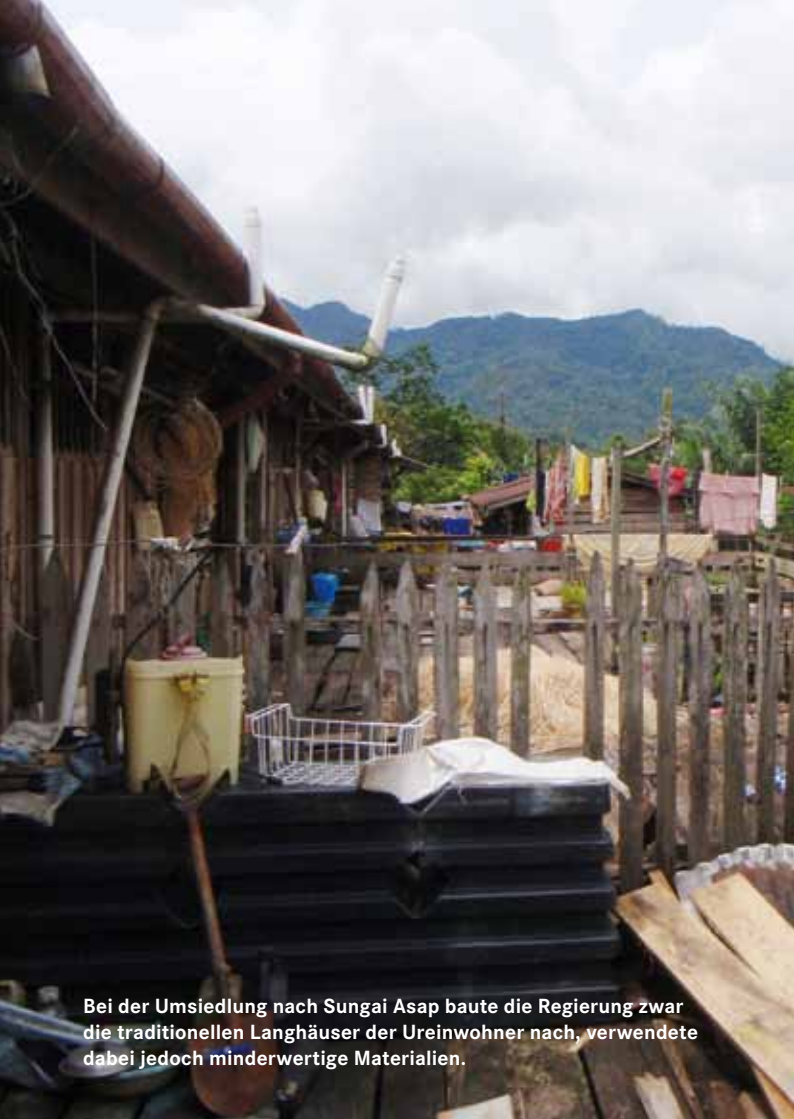
Bei der Umsiedlung nach Sungai Asap baute die Regierung zwar die traditionellen Langhäuser der Ureinwohner nach, verwendete dabei jedoch minderwertige Materialien.