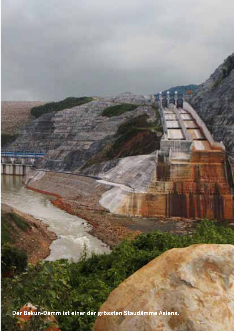
Der Bakun-Damm ist einer der grössten Staudämme Asiens.