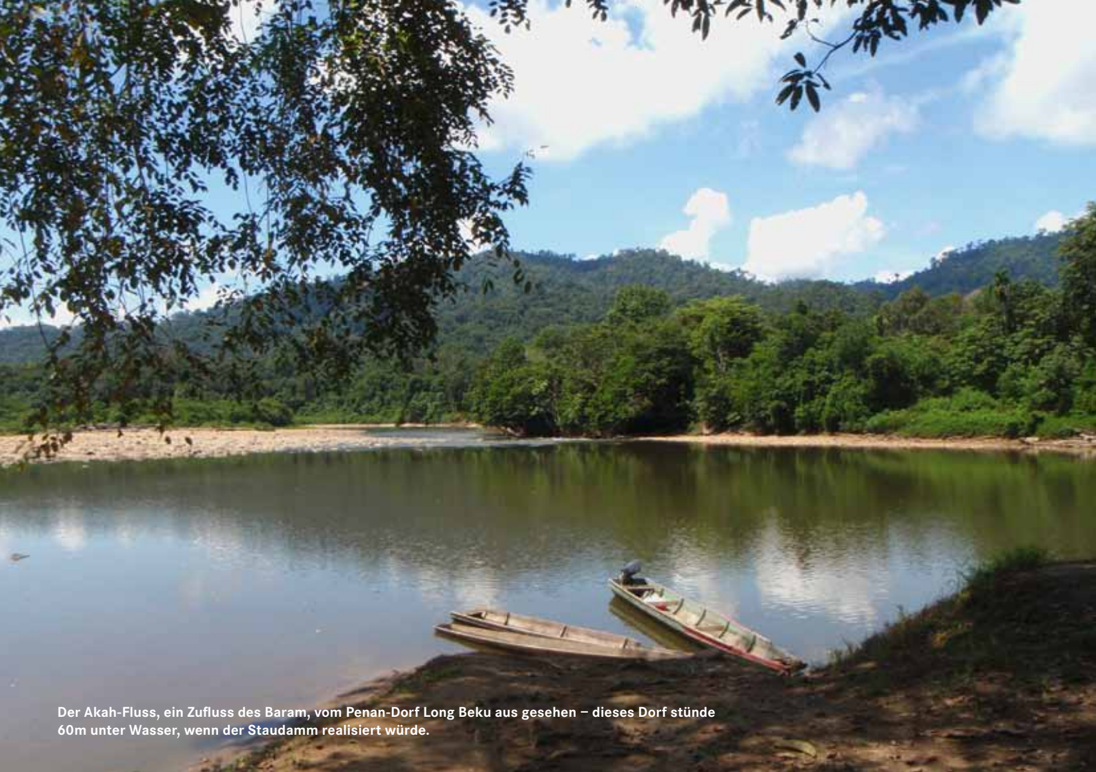
Der Akah-Fluss, ein Zufluss des Baram, vom Penan-Dorf Long Beku aus gesehen – dieses Dorf stünde 60m unter Wasser, wenn der Staudamm realisiert würde.